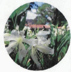
JARDÍN DE POLINIZACIÓN