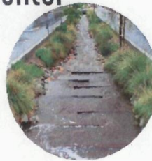
JARDÍN DE LLUVIA